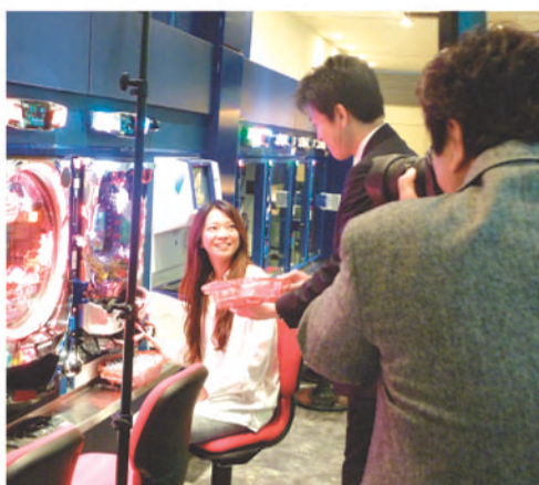
「はじめてパチンコ」撮影。玉がいっぱいになったので店員さんと呼んだ……

また、同月22日には日遊協本部会議室で第6回定例会を開き、「はじめてパチンコ」サイトのリニューアル目標を6月初めとすること、パチンコ・パチスロ関連サイトのマ