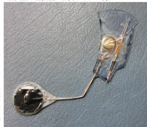
山佐の遊技機に仕掛けるクレ満クン

を見てみると、手作り感が満載のとても荒い作りが印象的なものでした。これは、もしかすると試作段階のものだったのかもしれない。他にゴト被害が発生していない理由が、このゴト器具が試作品だったというものであれば、今後の進化に注意が必要です。