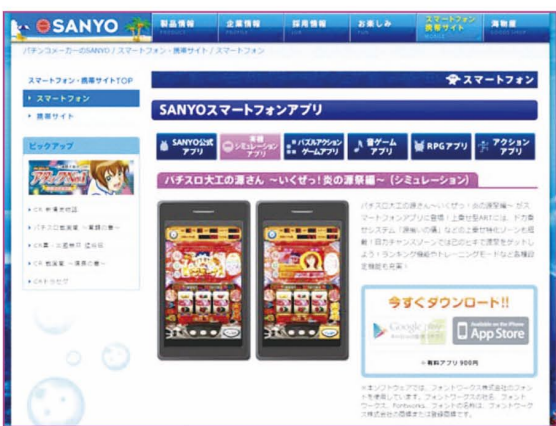
SANYOスマートフォンアプリ 実機シミュレーション

いくぜつ炎の源祭編」 「パチスロ海物語 ミラクルマリン」 「CR大海物語2」 「CRプレミアム海物語」の4機種に関しては有料(500円~1500円)で実機とほぼ同じ動きをするシミュレーターを提供しています(こちらもAndroid/iPhone両対応)。