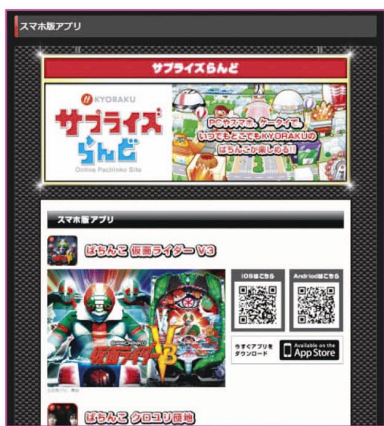
KYORAKU サプライズランド

「ぱちんこ 仮面ライダーV3」や「ぱちんこ クロユリ団地」など、KYORAKU製の機種の実機シミュレーションを提供しています。こちらもPCから始まったサービスのように、今のところスマートフォンはiPhoneのみ対応しています。