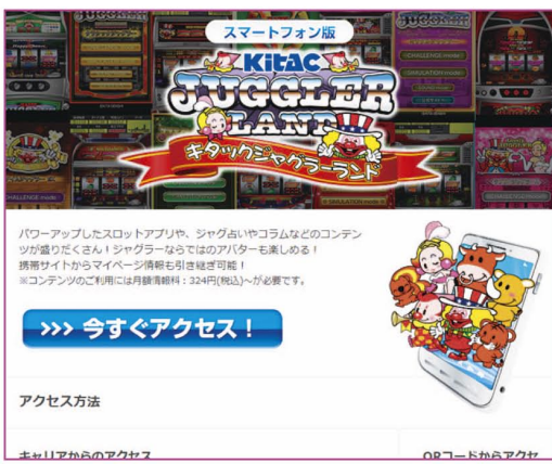
キタック キタックジャグラーランド スマートフォン公式サイト

キタックの提供する公式サイトです。月額3000円と5000円のコースがあり、金額に応じてもらえるポイントの数が違います。ジャグラーシリーズのシミュレータ