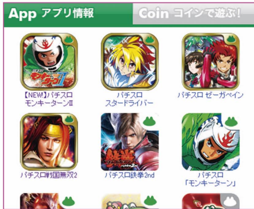
山佐 山佐スロワールド

ルサー」シリーズをはじめとしたスロットの情報が見られるほか、月額料金でアプリをダウンロードできます。月額3000円と6000円のコースがあり、3000円のコースだと料金内で遊べる機種に制限がありますが、6000円のコー