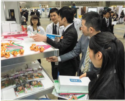
ノベルティグッズは人気を博した