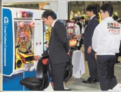
「どれどれ」と実技にチャレンジの学生さん