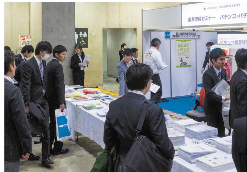
協賛企業のパンフレットも豊富にラインアップ

日遊協と人材育成委員会は3月7日、東京ビッグサイト（東京・有明）で開催された「リクナビSUPERスタートアップ★LIVE」に、「パチンコ業界特集」として「業界理解セミナー パチンコ・パチスロ編」と銘打ったブースを出展した。日遊協の「リクナビLIVE」参加は、2010年11月（東京ビッグサイト）、12年12月（千葉・幕張メッセ）、13年12月（東京ビッグサイト）に次いで4回目。