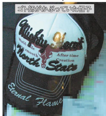
ゴト師がかぶっていた帽子

糸付き玉ゴトをやって旅ゴト遠征をして、北海道で折り返して九州に戻るともりだつたのでしよう。