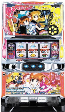
©KING RECORD CO.LTD. ©NANOHA The MOVIE 1st PROJECT ©NANOHA The MOVIE 2nd A's PROJECT