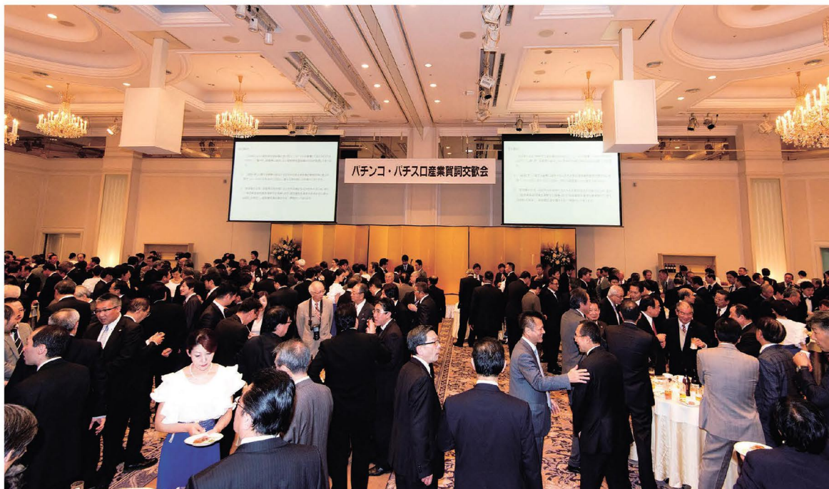
来賓を含め多くの参加者で盛りあがる賀詞交歓会の会場