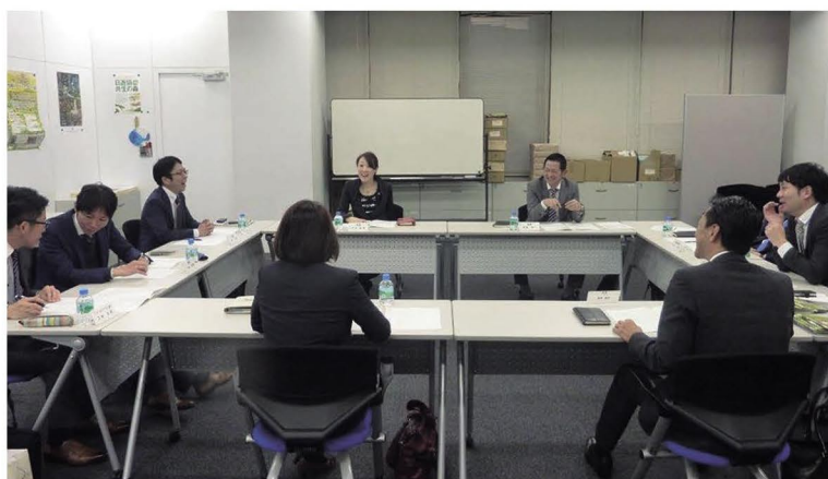
女性活躍推進フォーラム、ばちんこ産業合同説明会で協議した人材育成委員会

2月10日に催される第3回女性活躍推進フォーラム(東京・日本橋、三洋グループビル)の内容について、詰め協議を行った。同