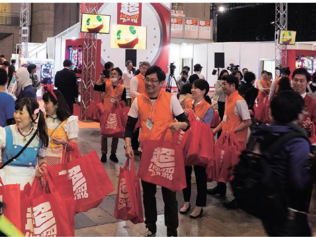
スタッフもグッズを持ってPRに大わらわ

日本遊技機工業組合、一般社団法人プリベイドシステム協会(オーイズミ、グローリーナスカ、ジョイシステムズ、ダイコク電機、日本ゲームカード、マースエンジニアリング、ユニバーサルエンターテインメント)、アウリス、エス・ビー・ジー、エース電研、キリンビバレッジ、浪速商事、ヤマダ