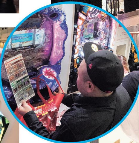
◀パチンココーナーも勉強しながら熱心にチャレンジ