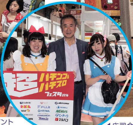
◀庄司会長も会場のアピールに一役