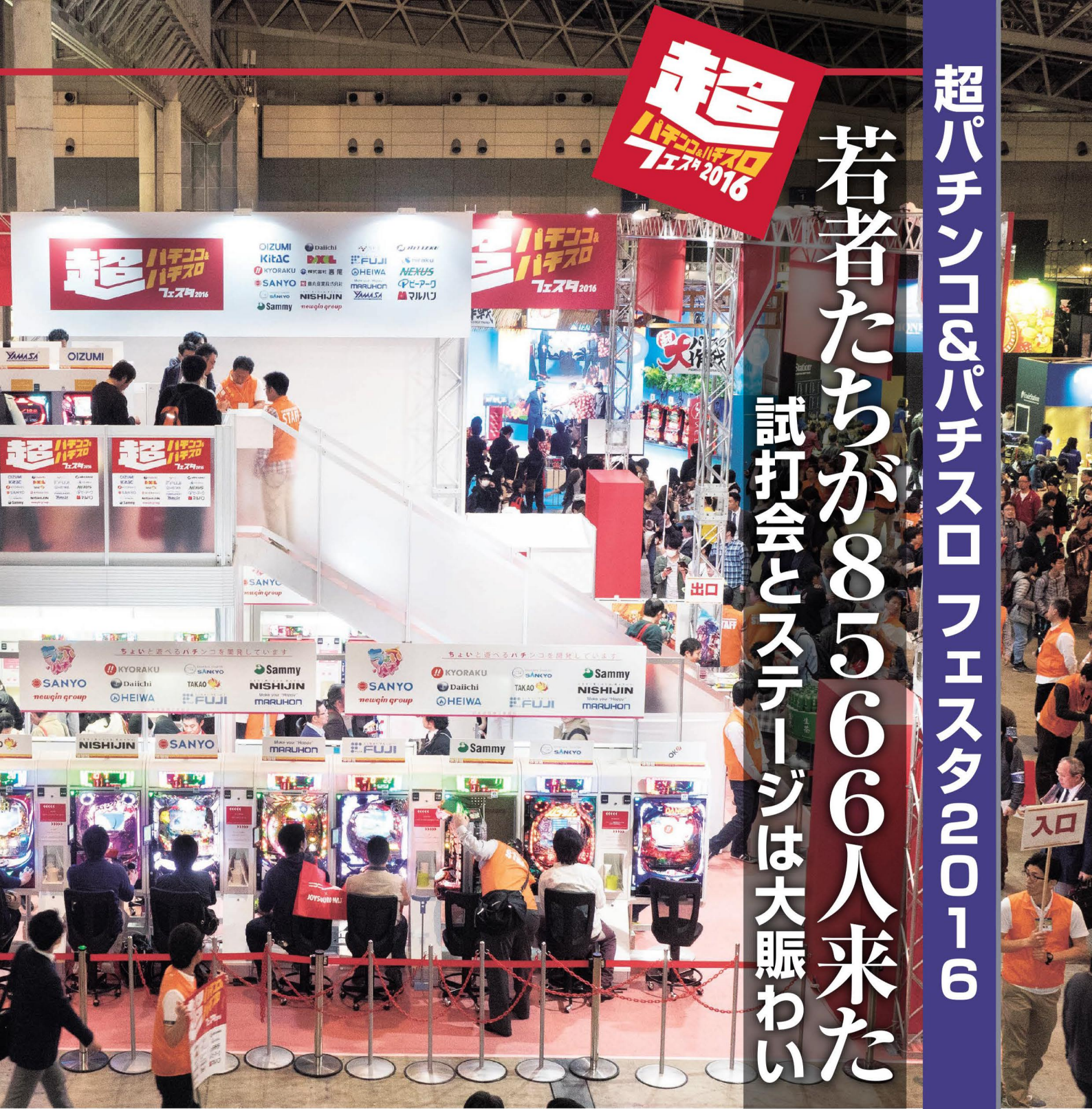
今年「フェスタ」は2階建てで立体的にブースを展開した

日遊協は4月29、30日、千葉・幕張メッセで開かれた(株)ドワンゴ主催の「ニコニコ超会議2016」に「超パチンコ&パチスロフェスタ2016」のブースを出展した。