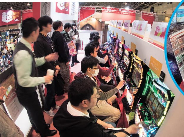
2階はパチスロコーナーで順番待ちとなった