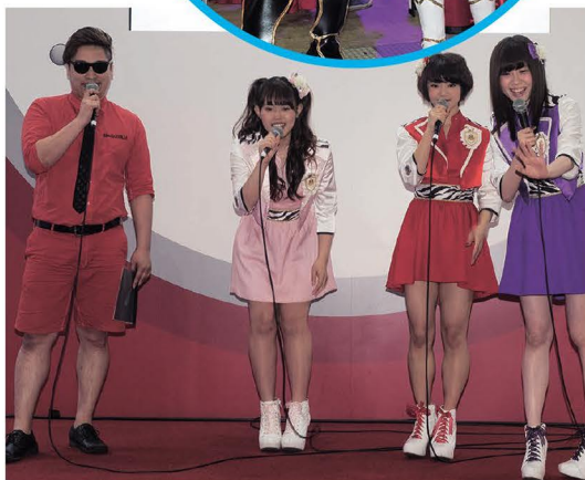
8.6秒バズーカやゼブラエンジェル

かなかありません。フェスタのブースも人で溢れPRの効果は十分上がったと思います。今年で3回目、内容も充実してきたと思いますが、ここまで持ってくるのはなかなかの苦労です。特に今回は横断的組織として、ホール企業などの協賛を幅広く求めたのですが、もう一つでした。今後は理解を深める作業を続け、このイベントをさらに強化したいと思っています」