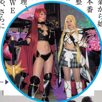
戦国乙女のコスプレイヤー

フェスタの裏方には、遊技機委員会を中心に会員企業から延べ約184人の社員が動員され、前日4月28日の遊技機搬入・設置などの準備作業から始