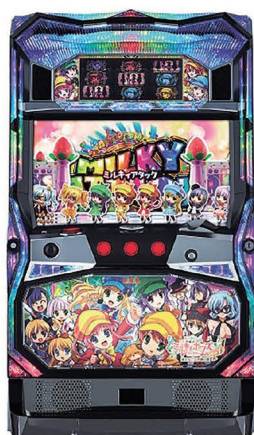
©ミルキィTD製作委員会 ©劇場版ミルキィホームズ製作委員会 ©bushiroad/Project MILKY HOLMES ©ふたりはミルキィホームズ製作委員会 ©DAXEL なんどろいと協力/GOOD SMILE COMPANY